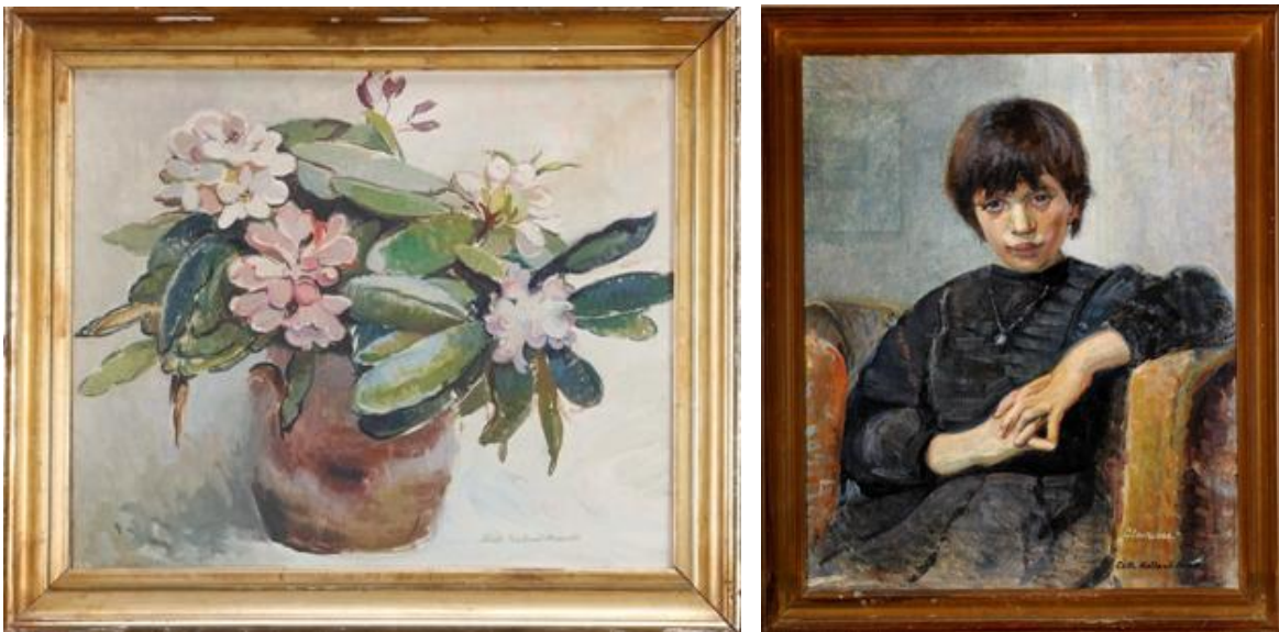
Disse 2 malerier er solgt på auktion i 2011. Tv: Rhododendron. Th: Clarisse.