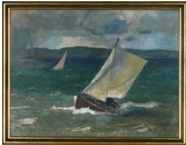
Billeder fra auktioner verden over.