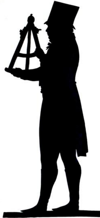
Søren Munch, maleri fra 1809 af Peder Faxøe. Privateje. Søren Munch med sin sekstant. Se større billede som pdf

Søren Munch, født 28. marts 1774 i Kristiania (Oslo), død 29. august 1865 i Stavanger, blev gift 18. oktober 1811 med Dorothea Catharina Wandal Randulff Bull, født 28. oktober 1781, død 17. januar 1861.